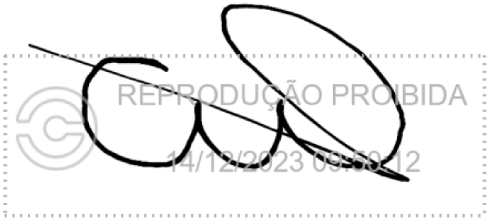
Caio Wermelinger de Souza 14 dez 2023, 09-50-12.png

Assinatura manuscrita com hash SHA256 prefixo b07ab0(...)